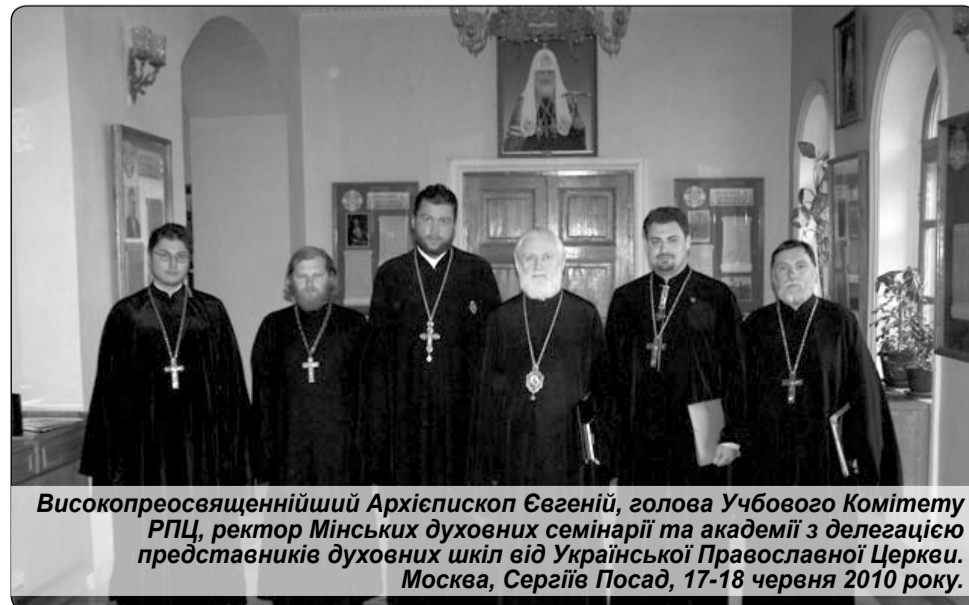
Високопреосвященніший Архієпископ Євгеній, голова Учбового Комітету РПЦ, ректор Мінських духовних семінарії та академії з делегацією представників духовних шкіл від Української Православної Церкви. Москва, Сергіїв Посад, 17-18 червня 2010 року.