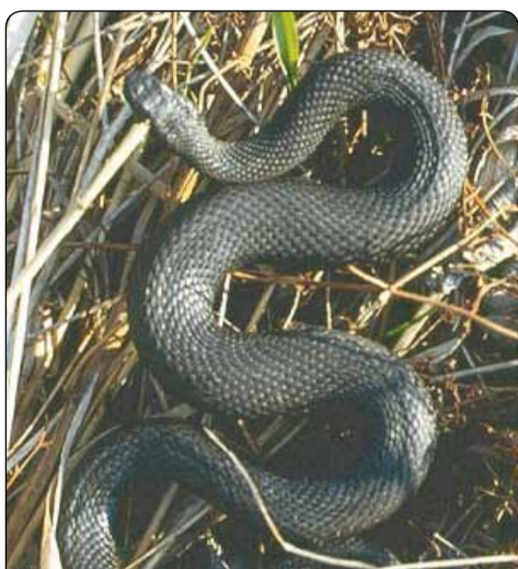
У центрі Ужгорода на пл. Театральній виявлено гніздо змії